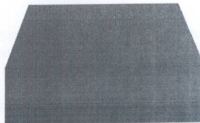
Спеціальне гумове покриття